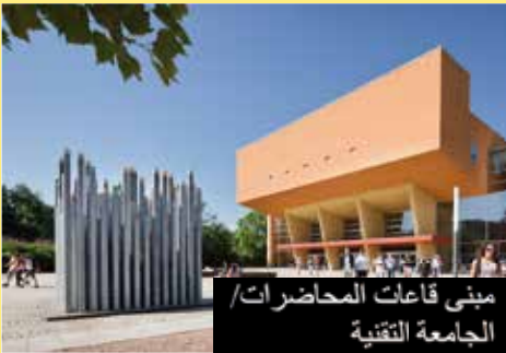
مبنى قاعات المحاضرات/ الجامعة التقنية