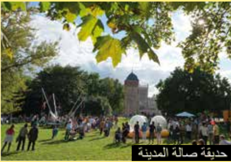
حديقة صالة المدينة