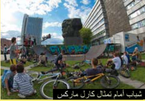
شباب أمام تمثال كارل ماركس