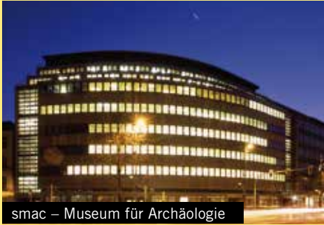
smac – Museum für Archäologie