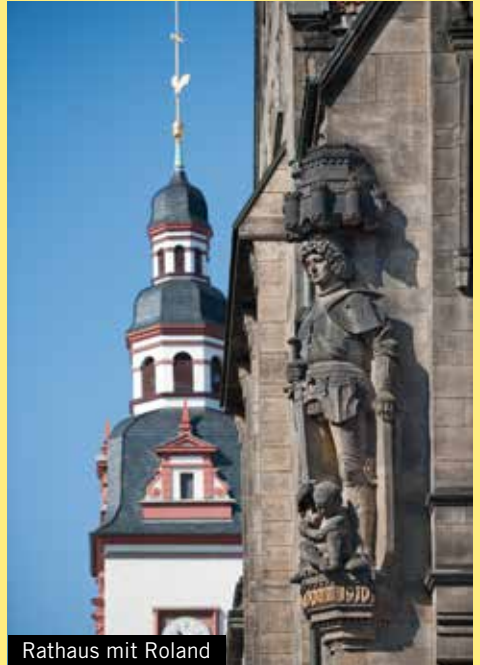
Rathaus mit Roland