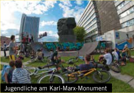
Jugendliche am Karl-Marx-Monument