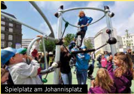
Spielplatz am Johannisplatz