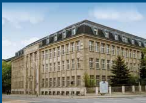
Annaberger Straße 93, 09120 Chemnitz

➤ Stadt Chemnitz – Bürgeramt, Meldebehörde