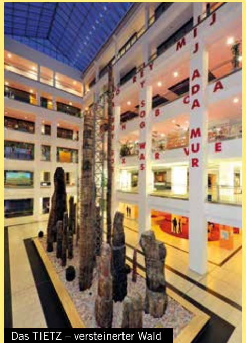
Das TIETZ – versteinertes Wald