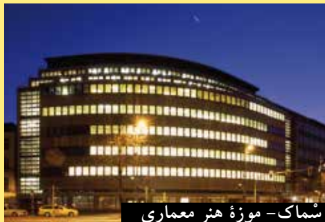
سماک - موزه هنر معماری