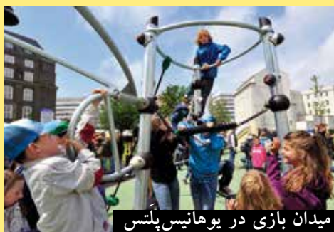
میدان بازی در یوهانیس پلتس