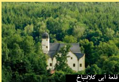
قلعه آبی کلافنباخ