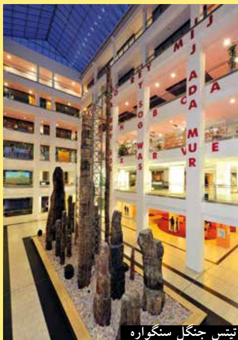
تیسس جنگل سنگواره