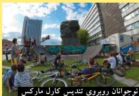
نوجوانان روپروی تندیس کارل مارکس