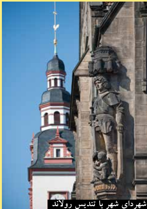
شهرهای شهر با تندیس رولاند