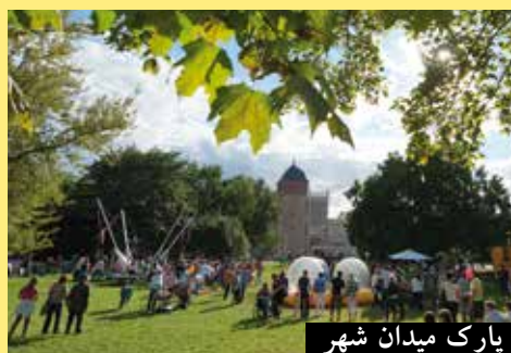
پارک میدان شهر