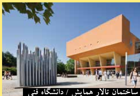
ساختمان تالار همایش / دانشگاه فنی